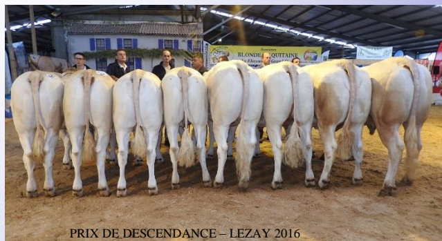
PRIX DE DESCENDANCE – LEZAY 2016